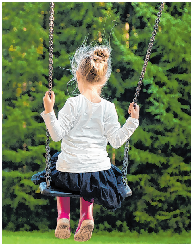
Spielplätze bieten inzwischen häufig mehr als nur eine Schaukel.