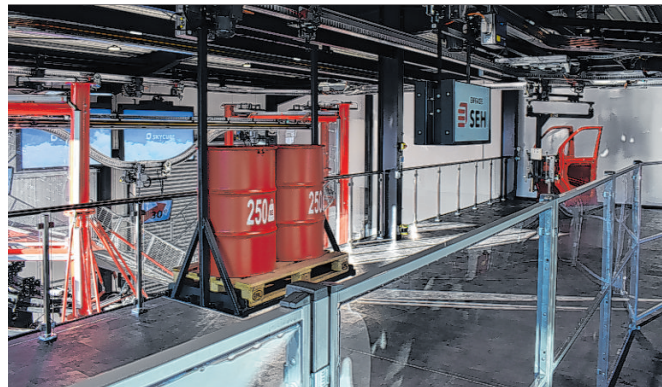
Dieses Bild zeigt die Elektrohängebahn Skyrail in der neuen Technikwelt. Diese bietet viele Vorteile gegenüber der klassischen Technik

von SEH Engineering gehören unter anderem Audi, BMW und Mercedes-Benz. „Doch mit unserer neuen Technikwelt wollen wir auch vermehrt Kunden aus dem Nicht-Automobilbereich ansprechen, wie bei-