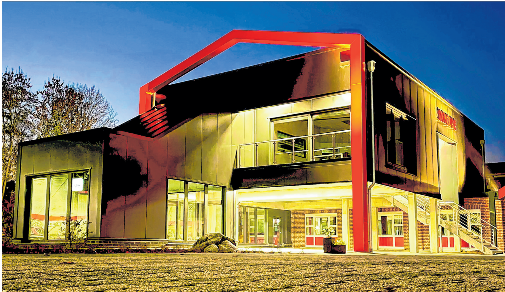
Die neue Technikwelt der Ostrhauderfehner Firma SEH Engineering befindet sich im Gewerbegebiet gegenüber vom Hagebaumarkt.